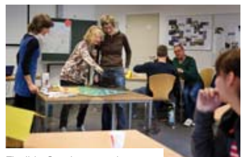
Flexible Seminargestaltung mit Equipment