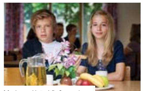
Moderne Unterkünfte und erweiterte Leistungsangebote