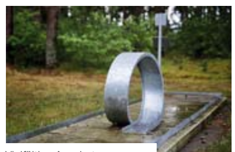
Vielältige Angebote zur Freizeitgestaltung