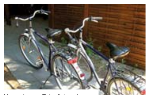
Hauseigene Fahrräder eignen sich für Erkundungen